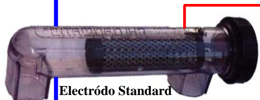
Electródo Standard OU